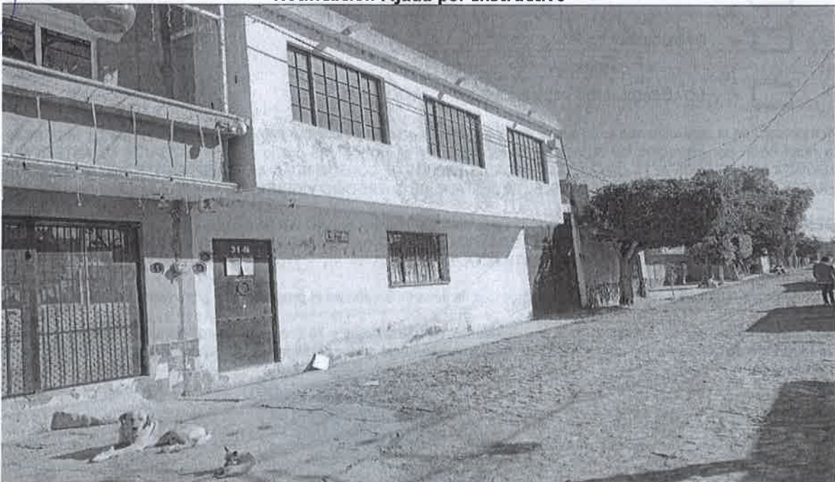
Inmueble No. 31 B