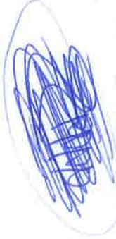
Notificación Fijada por Instructivo