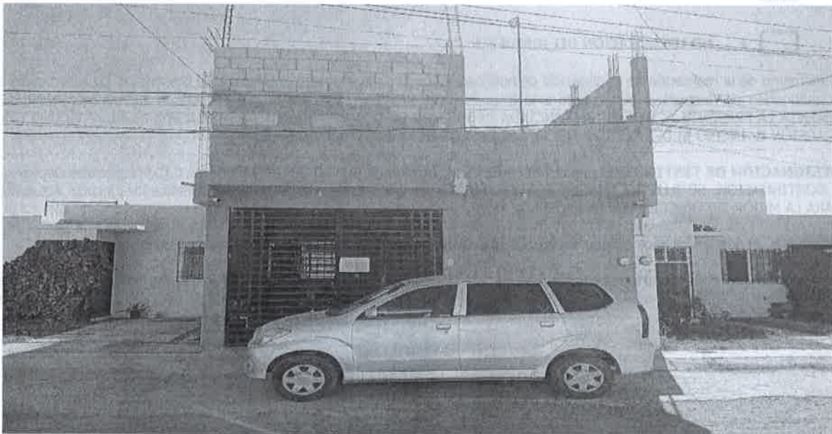
Inmueble No. 288