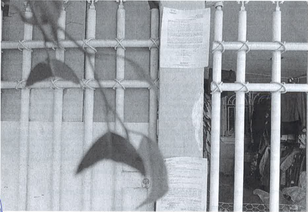
Notificación Fijada por Instructivo