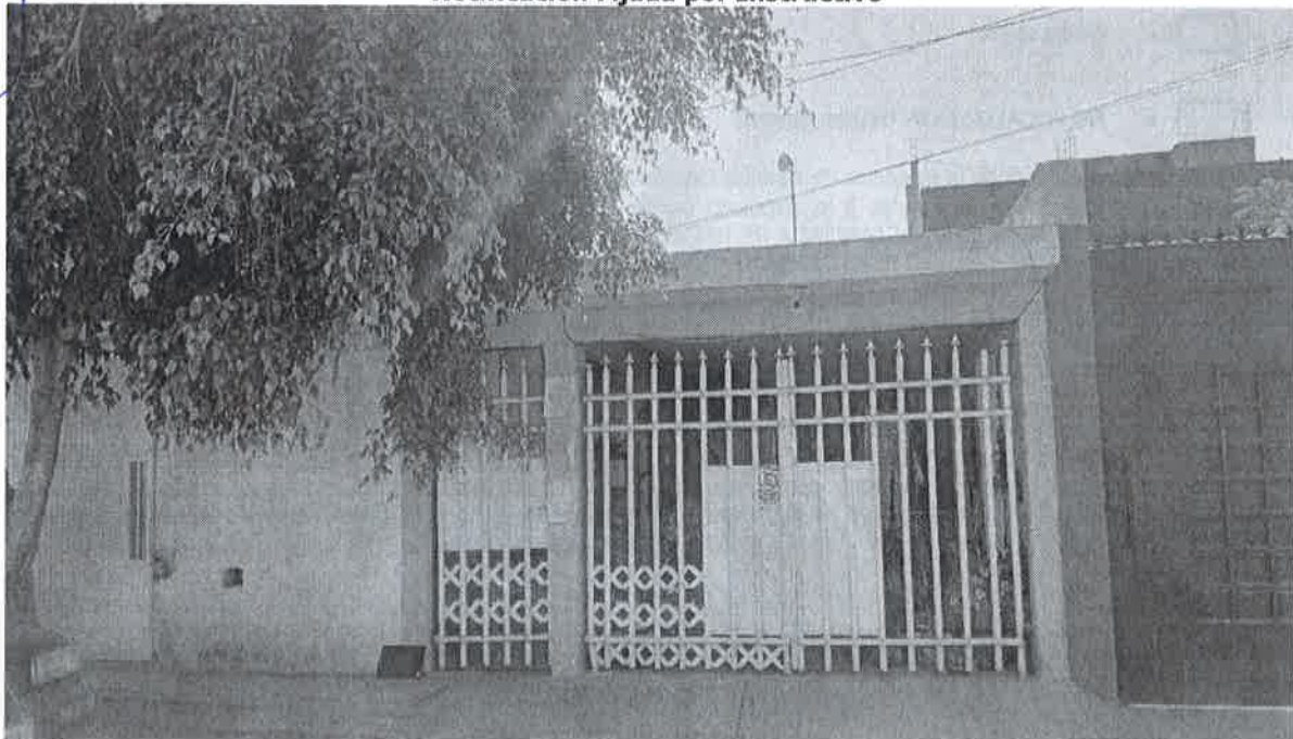
Inmueble No. 284