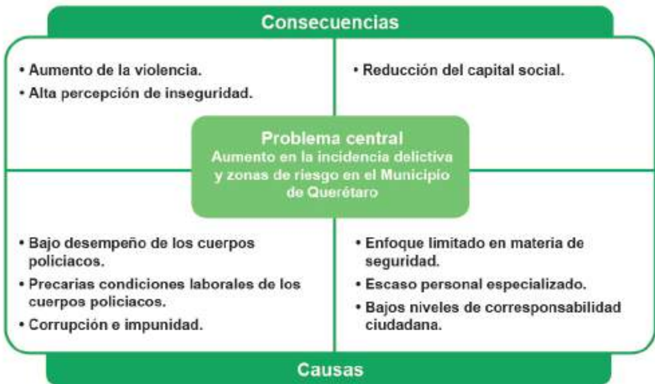
Figura No 1. Seguridad Pública en el Municipio de Querétaro. Causas y Consecuencias del Problema Central