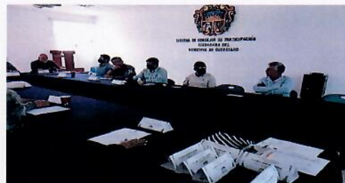
Página 3 de 4