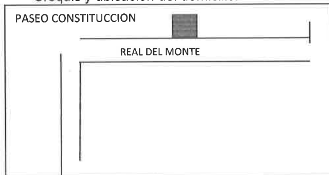
Croquis y ubicación del domicilio.

Nombre y Firma del Notificador - Ejecutor