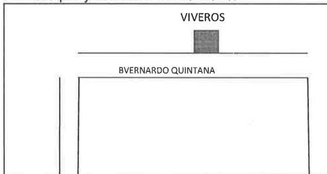
Croquis y ubicación del domicilio.

No habiendo más hechos que hacer constar y siendo las 13 horas y 20 minutos, del día de su fecha se da por terminada la presente diligencia.