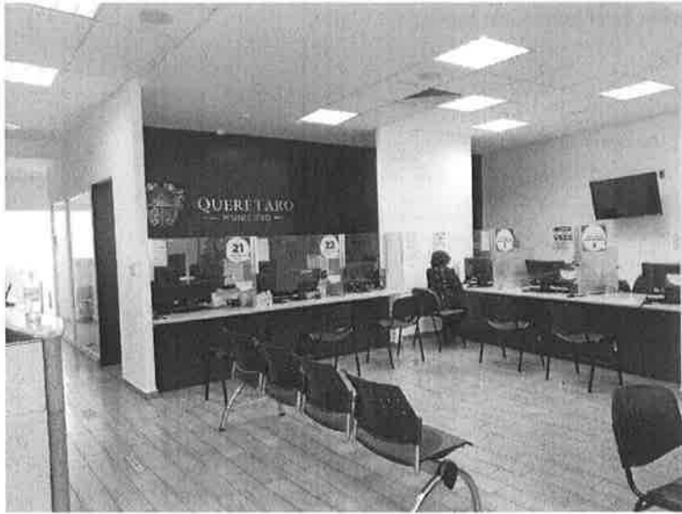
2) Módulo de Información ubicados en el Lobby de la Entrada Principal